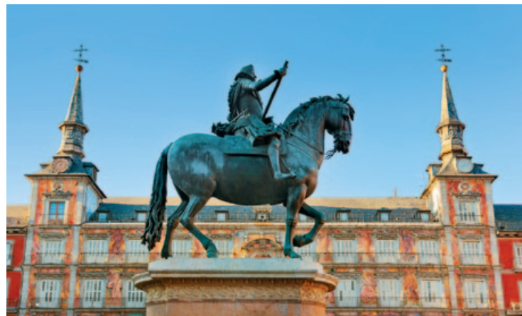
Konny pomnik Filipa III

Calle Mayor, biegnąca za północną ścianą Plaza Mayor i łącząca Puerta del Sol z Pałacem Królewskim, była niegdyś główną arterią Starego Miasta. W niewielkiej kamienicy pod nr. 61 mieszkał Pedro Calderón de la Barca , a pod nr. 59 mieściła się apteka Królowej Matki (małżonki Filipa V).