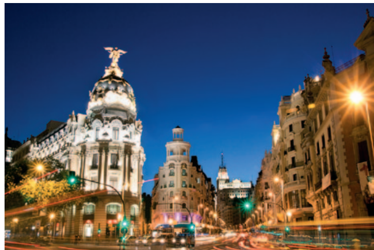
Eklektyczne budowle z końca XIX w. zdobią centrum miasta

Porośnięte sosnami i dębami górskie zbocza są zielonymi płucami stolicy, kiedy dokuca wszechogarniający upał, a zimą dają możliwość uprawiania narciarstwa. Jednak, mimo niezaprzeczalnych geograficznych atutów, miejsce wcale nie wydaje się być idealnym do założenia stolicy (brak dużej rzeki w okolicy, która w dawnych czasach stanowiła ważny